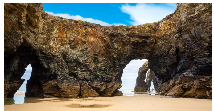
Playa de las Catedrales

Mit Porto erreichen wir die zweitgrößte Stadt des Landes. Die Stadt liegt am Douro Fluss und besitzt eine Altstadt, die von der UNESCO in ihrer Gesamtheit zum Weltkulturerbe erklärt wurde. Das Altstadtviertel Ribeira liegt an der Mündung des Douro und windet sich in engen Gassen den Hügel hoch. Die Uferpromenade Cais de Ribeira hat sich zu einem angesagten Viertel gemausert. Ein Blickfang ist die Bogenbrücke Ponte Luís I. Sie verbindet die historische Altstadt mit der benachbarten Stadt Vila Nova de Gaia. Fast 390 Meter lang ist das Bauwerk, das 1886 freigegeben wurde. Weiters sehen wir u.a. die Kirche São Francisco, den Börsenpalast und den Bahnhof São Bento, der mit seinen etwa 20.000 Azulejos, den bunt gestalteten Keramikacheln, ein Kunstwerk ist. Wir haben noch Freizeit für individuelle Unternehmungen, ehe der Transfer zum Flughafen Porto und der Rückflug nach Wien erfolgt. (F)