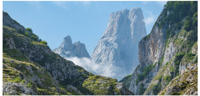
Picos de Europa

Wir beginnen den Tag mit dem Besuch der Nachbildung der berühmten Höhle von Altamira (E). Um ihre Erhaltung zu gewährleisten, sind in der Original-Höhle keine Besucher erlaubt. Bisons, Hirsche und Wildschweine preschen über die Wände der Höhle. Was uns die Steinzeitkünstler wohl sagen wollten? Wir rätseln vor einigen der frühesten Kunstwerke der Menschheit - die Malereien sind ca. 14.000 Jahre alt und wurden zum UNESCO Weltkulturerbe erklärt. In Covadonga, Heiligtum von Asturien, wurde spanische Geschichte geschrieben. Hier begann die Vertreibung der Mauren bzw. die Epoche der christlichen Rückeroberung Spaniens. Die Basilika (E) neben der Höhle, in der das Bildnis der Santina verehrt wird, ist Kultstätte und in ihrem Inneren befinden sich wertvolle Kunstschatze.